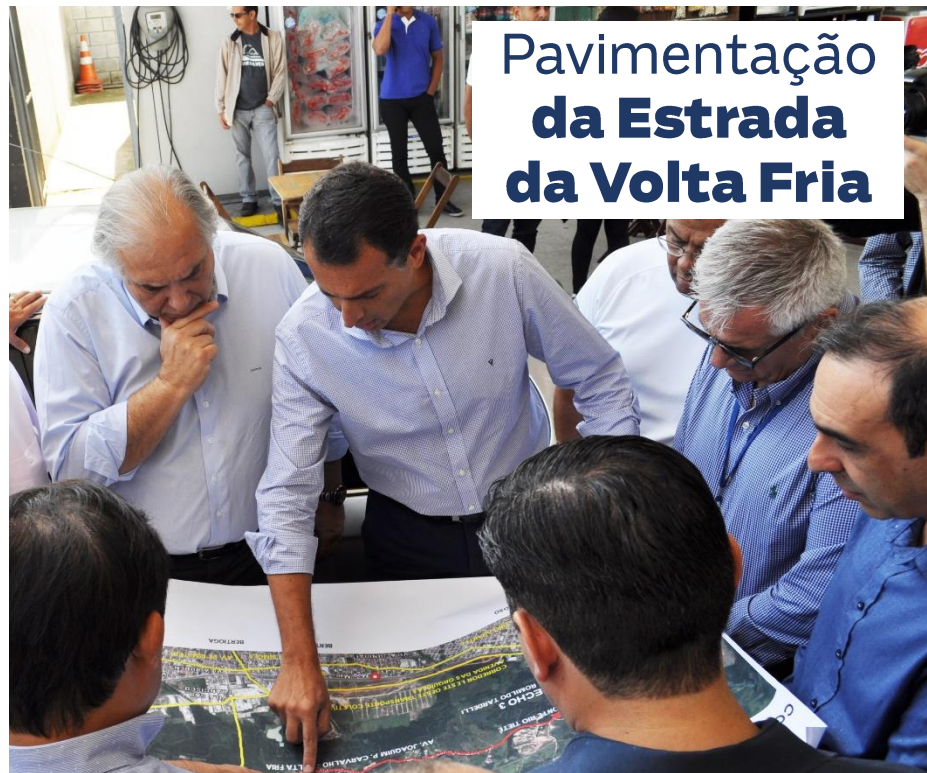
Pavimentação da Estrada da Volta Fria